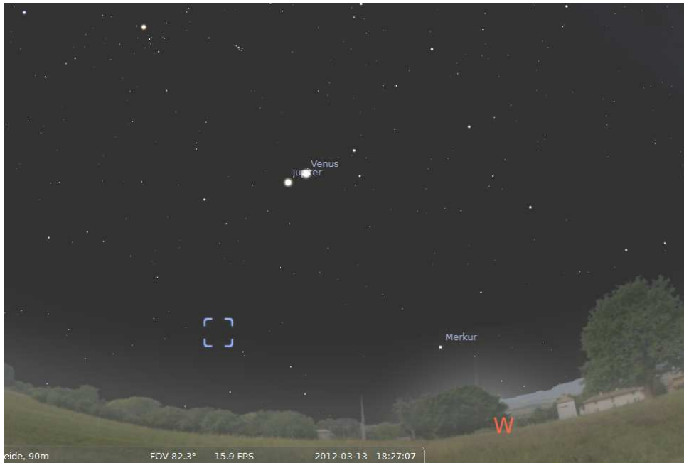
Abb. 2 Venus und Jupiter bei der Konjunktion am 13.03.2012.